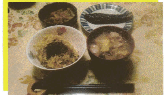
玄米 豚汁 ふきの煮物 ナスの素揚げ