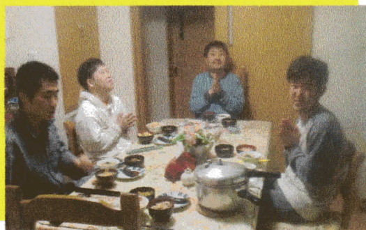
この時間はみんな笑顔で楽しみます。