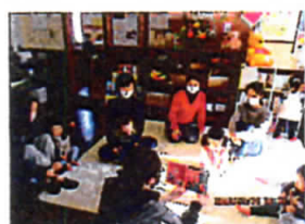
英語で絵本の読み聞か