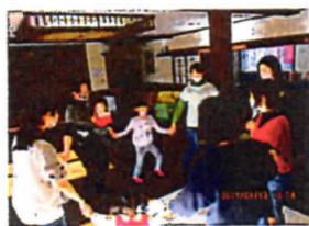
英語の歌に合わせてダンス