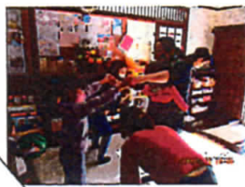
お手玉あそびをしました